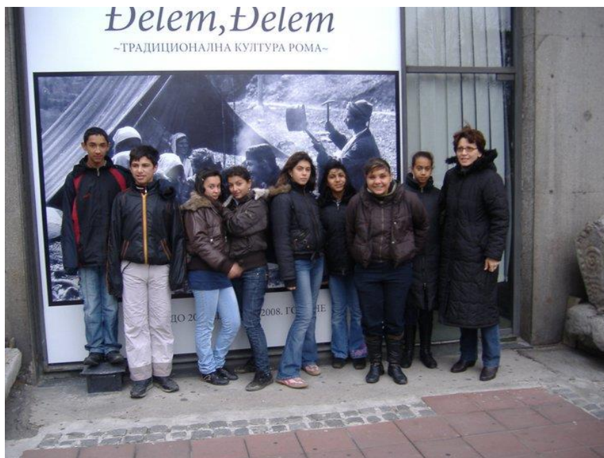
У Библиотеци „Свети Сава“