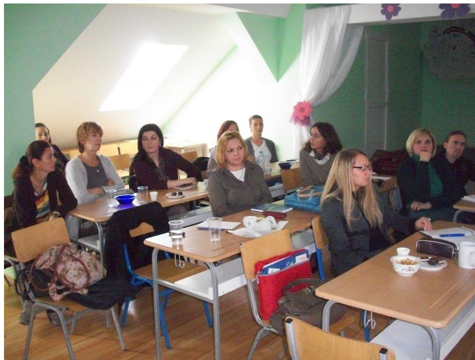
Друштво школских библиотекара 10 година ДШБС