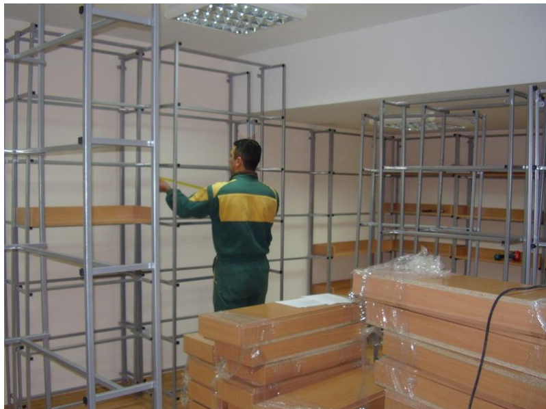
Опремљена библиотека за рад са ученицима